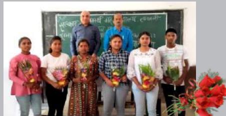
महाविद्यालयाच्या इयत्ता 12 वी मधील यशस्वी विद्यार्थी 2022-23