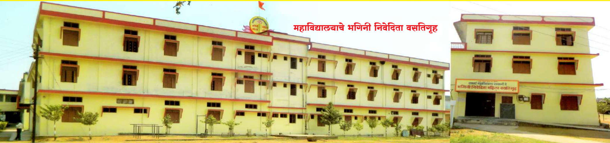
महाविद्यालयाचे भगिनी निवेदिता वसतिगृह