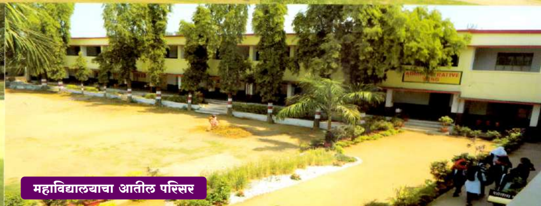
महाविद्यालयाचा आतील परिसर